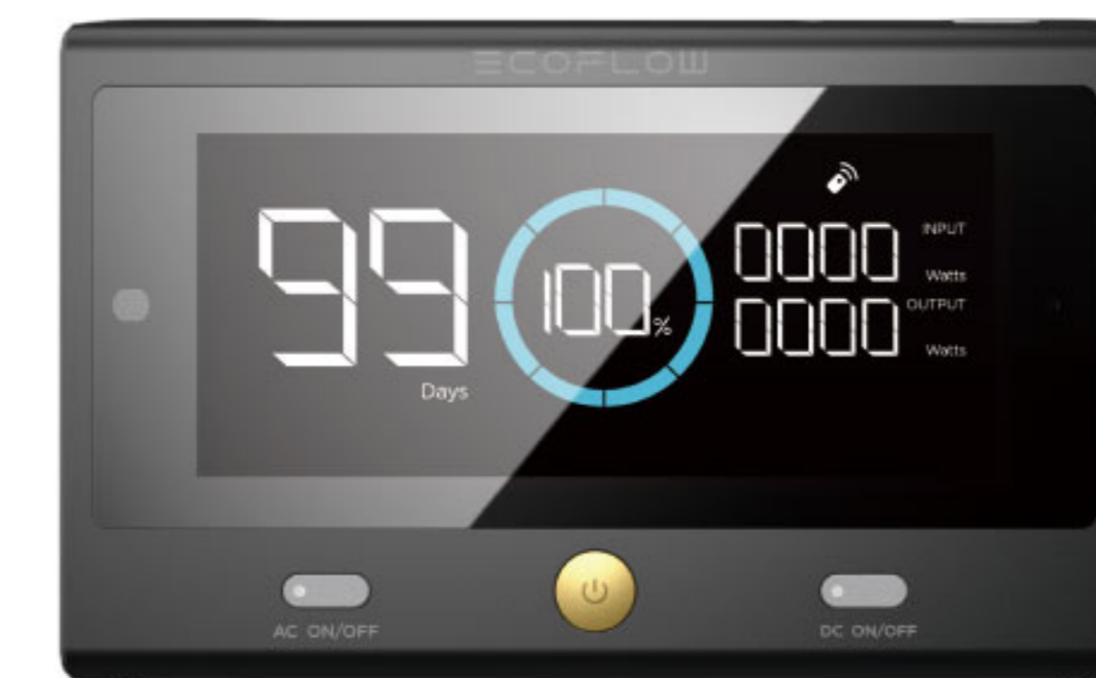
DELTA Pro用 リモートコントローラー ¥11,550(税込)

お使いのスマートフォンに専用アプリをダウンロードすることで、スマートフォンとペアリングし遠隔操作が可能になります。また、スマートフォンをお持ちでない方のために、オプションの「DELTA Pro専用 リモートコントローラー」でもスマートフォン同様に遠隔操作を可能にしました。