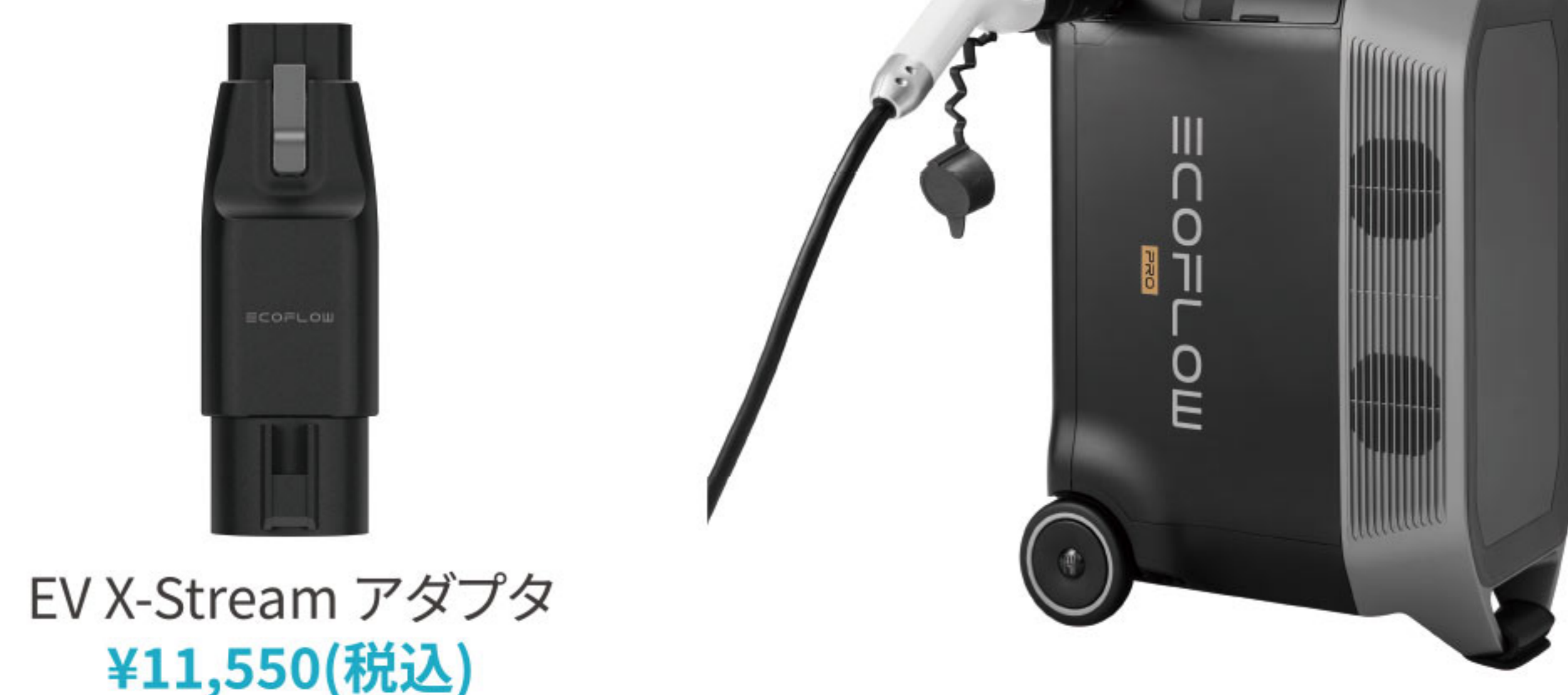
EV X-Stream アダプタ ¥11,550(税込)

※1.EVステーションの利用時間は各施設のルールに従って下さい。 ※2.EVステーションで充電の際は、別売りの「EV X-Streamアダプタ」が必要です。