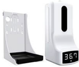
K9 Pro 専用 卓上スタンド