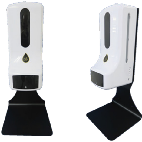
卓上スタンド 日本製（別売り）