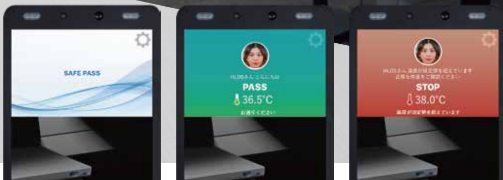
サイネージ表示時

縦長軽量のAI インタラクティブ ディスプレイは、サイネージやメッセージボードをはじめ、様々な用途や場所でお気軽にご利用いただけます。顔認証機能による個人識別、熱やマスク着用検知などの機能を備えており入室管理や感染症対策としても活用できます。