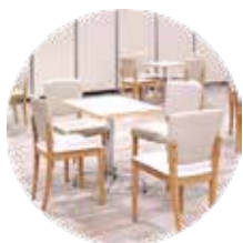
テーブル・イス等

UVライトセーバーの電源スイッチを入れて、除菌対象物に近づけると自動的にUVライトが発光し、除菌状態になります。除菌・殺菌したい机、イスなどの対象物にかざすだけで除菌が終了します。そのため、短時間で広範囲の除菌することが可能です。(対象物から離れると自動的にUVライトは消灯します。)