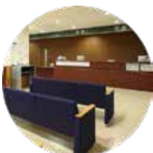
人が集まる待合室