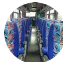
バスや車のシートや手すり