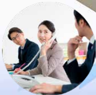
■オフィス・公共施設